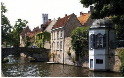
Dieses Dokument ist urheberrechtlich geschützt durch GTW Touristik GmbH. Alle Rechte vorbehalten.